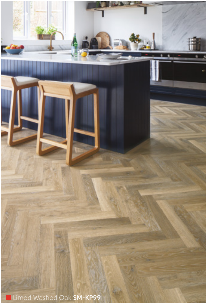
Limed Washed Oak SM-KP99