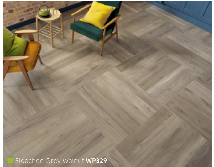
Bleached Grey Walnut WP329